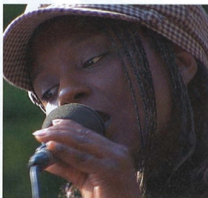
La cantante Judith Emeline sarà l'ospite d'eccezione del concerto d'apertura dei festeggiamenti.

deciso di stampare un calendario per il 2014 corredato di foto riguardanti sia la Filarmonica sia la CEF. Su calendario sono riportate tutte le date importanti dell'anno del 150° nonché un paio di inserti storici riguardanti le due società. Questo calendario è già stato distribuito gratuitamente alla popolazione.